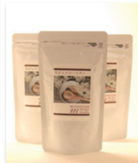
「βグルカン」豊富、ヘルシーで注目の 「はなびらたけパウダー」