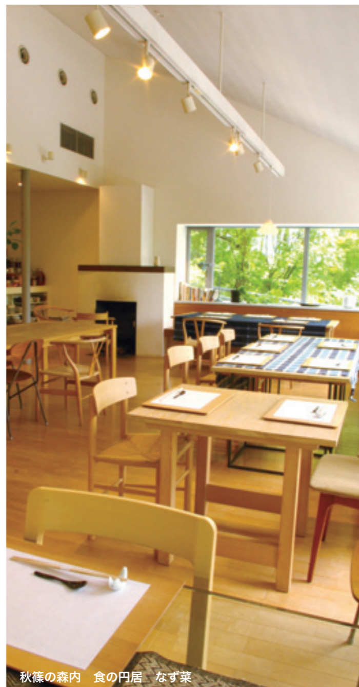
秋篠の森内 食の円居 なず菜