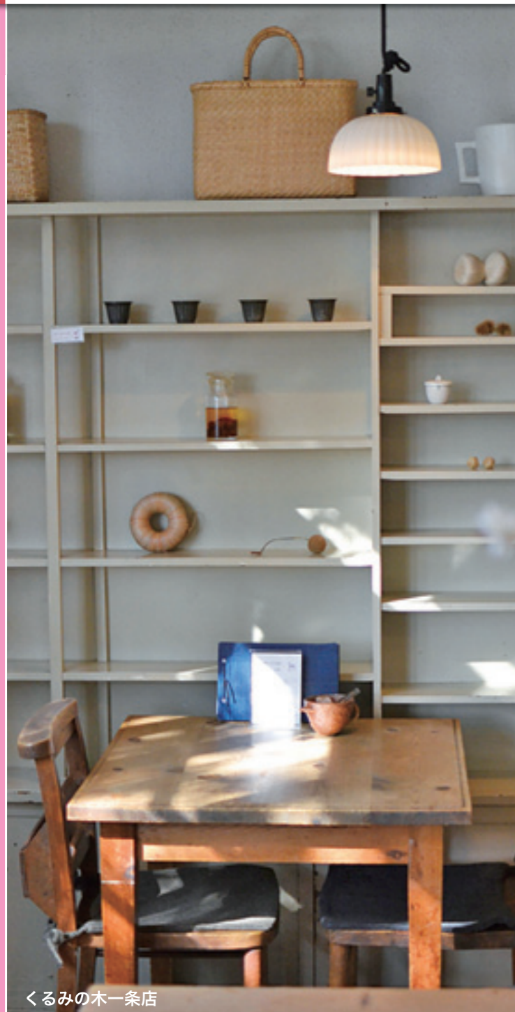
くるみの木一条店