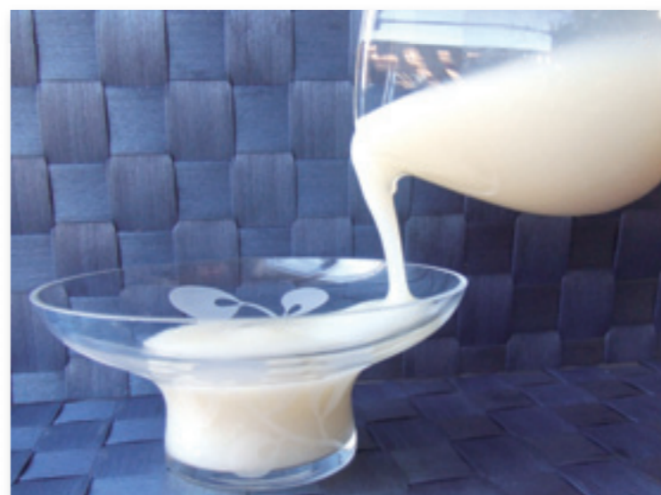
麺やスイーツなどの食感を変える「ハナビラタケ・ピュアレ」