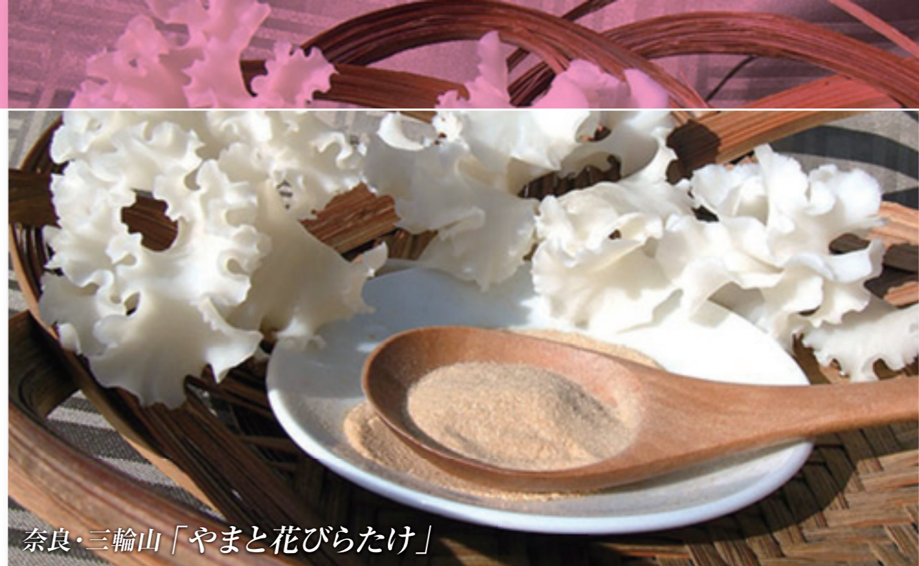
奈良・三輪山「やまと花びらたけ」